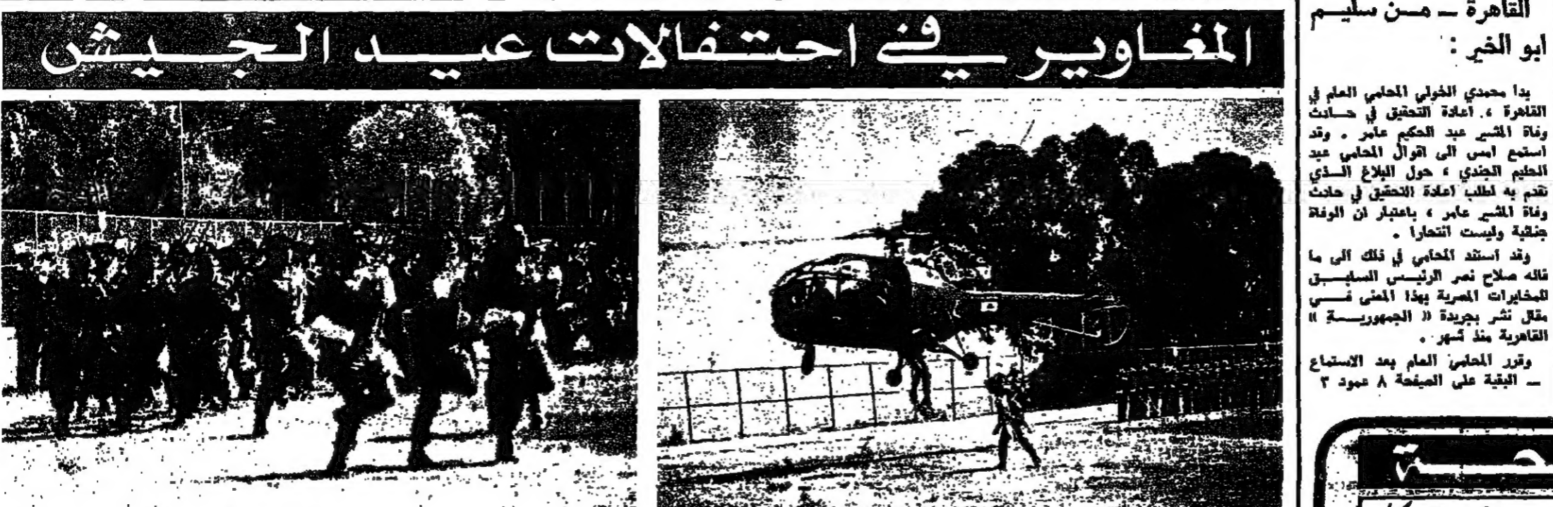
المعاويز في احتفالات عيد الجيش

المعاويز في احتفالات عيد الجيش في حلة تخرج الضباط الجدد بالدرسة البحرية يوم امس الاول . نقل جنديان من فرقة المعاويز من طائرة هاينكوتس ، وركزا في ساحة المدرسة باقطة كتب عليها «لبنان قاهر الازمات» . كما اشتركت مجموعة ريفية من المعاويز بالمرش المسكري ، كما يدير في الصورين .